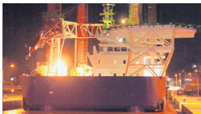
Die „Wind Lift 1“ am späten Sonnabendabend in der Emden Seeschleuse.

Voraussichtlich heute werde das Spezialschiff seine Arbeit aufnehmen und zunächst drei 90 Meter lange Fundament-Rohre in den